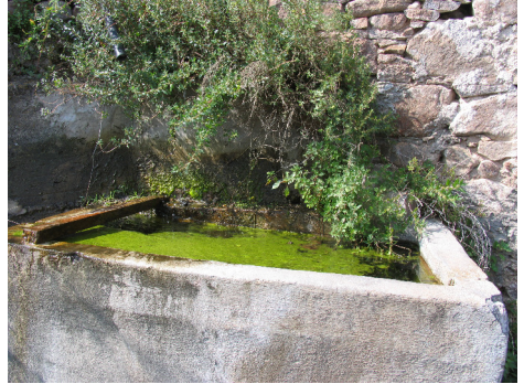
Esempio di sito riproduttivo di Ululone dal ventre giallo Bombina variegata in Val di Cembra.

mescola al liquame. In Trentino, la specie è attiva fra aprile e ottobre, con un picco fra maggio e giugno, periodo in cui è stata segnalata anche la presenza di ovature e girini [15].