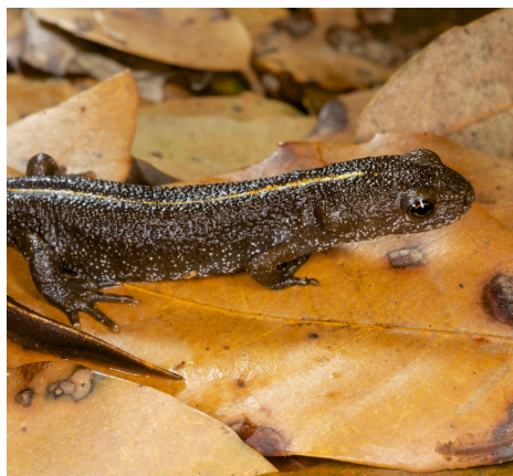
Tritone crestato italiano Triturus carnifex . Dopo la fine della stagione riproduttiva il Tritone crestato italiano conduce vita terrestre, la cresta viene riassorbita, la pelle si ispessisce e il colore di fondo si fa più scuro. Caccia piccoli invertebrati sul terreno di notte, con tempo piovoso.

materiali organici. Specie pioniera, colonizza rapidamente raccolte d'acqua temporanee di origine naturale o artificiale, come vasche, pozzanghere e contenitori anche di piccole dimensioni. Durante la fase terrestre frequenta ambienti ombrosi, cercando riparo sotto pietre, nelle fessure tra le rocce o nel sottobosco, fra rami, tronchi e fogliame marcescente; gli stessi anfratti costituiranno anche i rifugi invernali [6] [9] [17] [19].