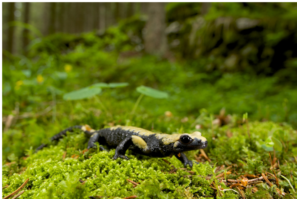
Salamandra di Aurora Salamandra atra aurorae . Salamandra di Aurora nel suo ambiente naturale sull'altopiano di Vezzena.

rischiose per la specie come anche l'inquinamento da scarichi civili e zootecnici. In generale, modifiche ambientali che comportano il degrado di aree utilizzate come siti di svernamento o l'eliminazione di rifugi come cataste di legno, muretti a secco, mucchi di sassi e rocce, costituiscono un serio problema per questi animali. Inoltre anche isolamento e dimensione ridotta delle popolazioni, contribuiscono a renderne fragile l'equilibrio risultando quindi particolarmente vulnerabili a eventuali patologie e soggette a fenomeni di inbreeding (accoppiamento tra consanguinei). Le trasformazioni agricole e urbanistiche, specialmente delle zone di fondovalle, hanno ridotto l'estensione di boschi e agroecosistemi tradizionali caratterizzati da siepi, fossati e piccole raccolte d'acqua causando quindi, come nel caso del tritone crestato italiano, una notevole diminuzione di habitat. Sui rilievi invece l'abbandono delle malghe e le trasformazioni di vasti settori a scopo urbanistico, turistico e sportivo, hanno causato una notevole riduzione sia del numero di popolazioni sia di esemplari [9] [14].